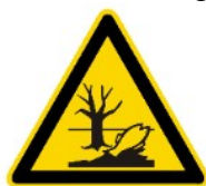
Dangereux pour l'environnement