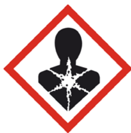
Dangereux pour la santé