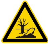
Dangereux pour l'environnement