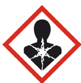
Dangereux pour la santé