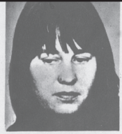
Meinhof, Ulrike, 7. 10. 34 Oldenburg

Wegen Beteiligung an Morden, Sprengstoffverbrechen, Banküberfällen und anderen Straftaten werden steckbrieflich gesucht: