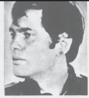
Baader, Andreas Bernd, 6. 5. 43 München