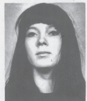
Möller, Irmgard, 13. 5. 47 Bielefeld