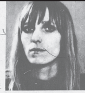
Ensslin, Gudrun, 15. 8. 40 Bartholomae