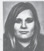
Mohnhaupt, Brigitte, 24. 6. 49 Rheinberg