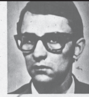
Meins, Holger Klaus, 26. 10. 41 Hamburg